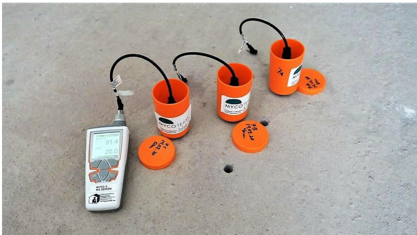
Prøver fra murpuss eller andre materialer med potensielle fuktskader kan sendes inn og testes i laboratorium.

Under nedstengningen begynte Mycoteam med fjerninspeksjon av bygninger. – Definitivt noe vi kommer til å fortsette med, sier Tage Rolén.